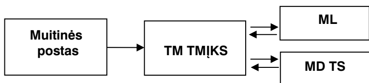
2 pav. Mėginių klasifikavimo schema

b) Prekių klasifikavimas muitinio įforminimo metu atliekamas vadovaujantis teisės aktais, reglamentuojančiais prekių deklaravimą ir muitinį tikrinimą, taip pat prekių mėginių klasifikavimo nuostatai [7] (žr. 2 pav.). Įforminant muitinės deklaraciją prekėms, deklaruojamoms išleidimo laisvai cirkuliuoti muitinės procedūrai, nustatoma, ar šios prekės nėra priskirtinos prekių kategorijai, kurioje dažniausiai pasitaiko prekių klasifikavimo klaidų, ar šioms prekėms taikomos muitų ir (arba) mokesčių lengvatos, ar išleidimo laisvai cirkuliuoti atvejis nepriskirtinas tam atvejui, kai klasifikuojant prekę dėl jos klasifikavimo sudėtingumo yra galimybė ją klasifikuoti keliose subpozicijose ir yra tikimybė, kad ji bus deklaruota toje subpozicijoje, kurioje klasifikuojamoms prekėms mokesčiai nenustatyti arba nustatyti mažesni, arba sąmoningai neparinkta KN subpozicija, siekiant mokesčių nemokėti arba mokėti mažesnius už nustatytuosius mokesčius, arba išvengti nustatytų importo draudimų ir/arba apribojimų, arba papildomo muitinės vertės tikrinimo. Nustatant nurodytas prekių klasifikavimo klaidų atsiradimo sąlygas ir aplinkybes, vadovaujamosi teisės aktais, kuriais nustatomi muitų ir kitų mokesčių tarifai bei lengvatos, Centriniais ir teritoriniais rizikos profiliais, ASYCUDA atrankos moduliais ir kita muitinėje turima informacija, susijusia su prekių klasifikavimo klaidų rizika ir šių klaidų prevencija.